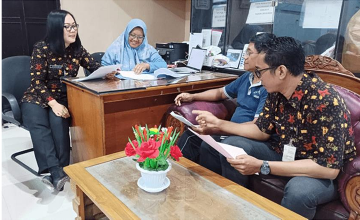
Monitoring dan Evaluasi Bulanan atas Kepatuhan terhadap Waktu Penyelesaian Layanan