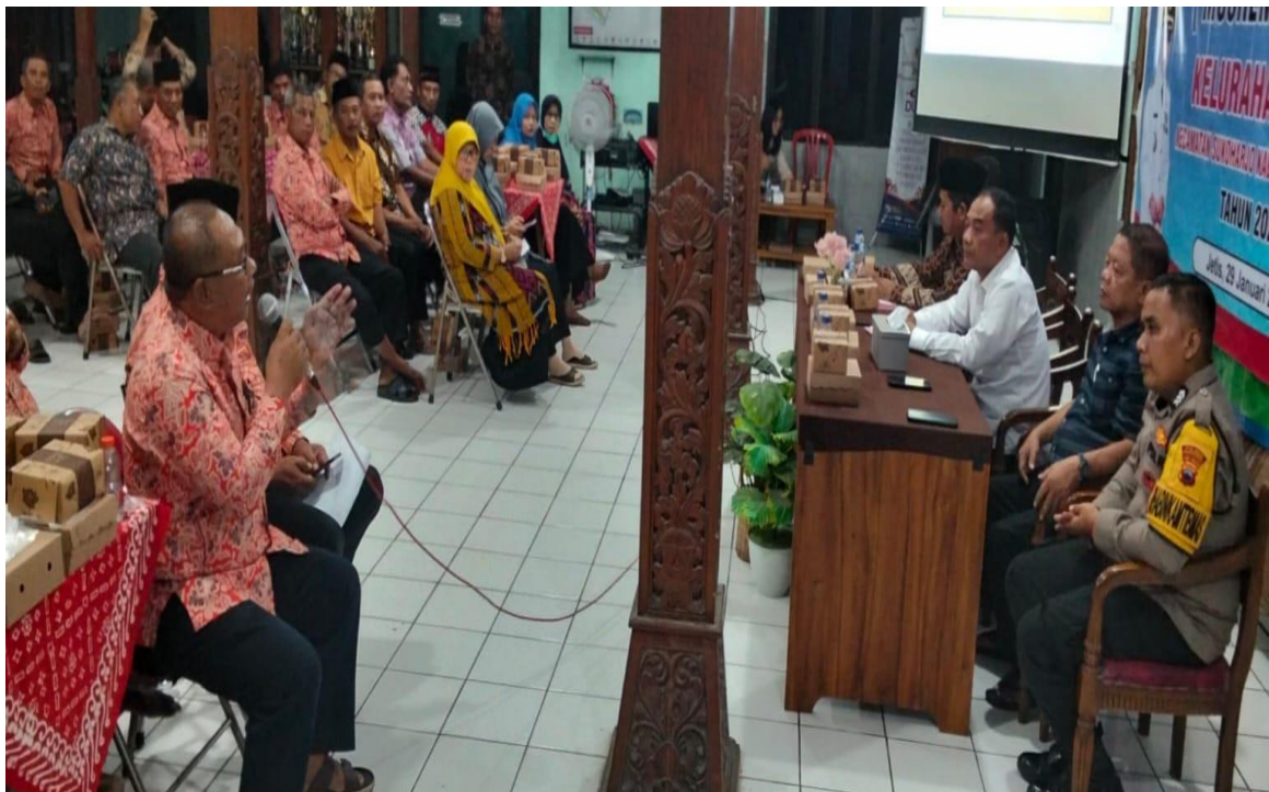
Sosialisasi tentang Jenis Layanan dan Produk Kelurahan Jetis