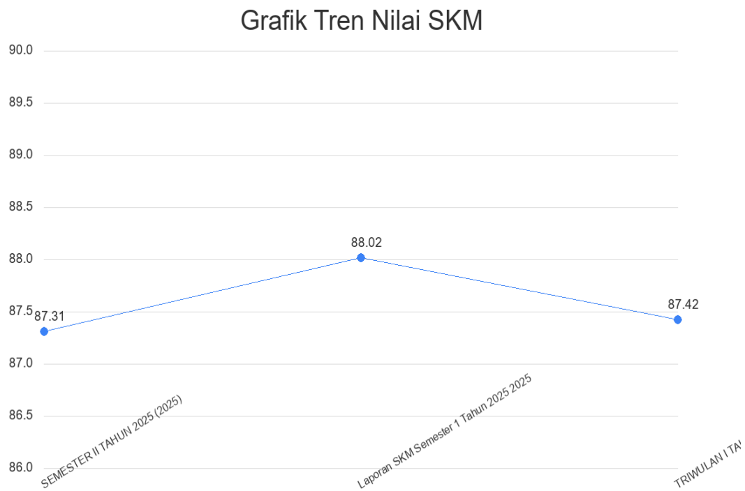
Gambar 2.2. Grafik Tren Nilai SKM

Tren tingkat kepuasan penerima layanan Kelurahan Jetis selama beberapa periode terakhir dapat dilihat melalui grafik di bawah ini. Grafik ini menggabungkan data historis yang diarsipkan dengan data yang dihasilkan oleh sistem untuk memberikan gambaran yang komprehensif.