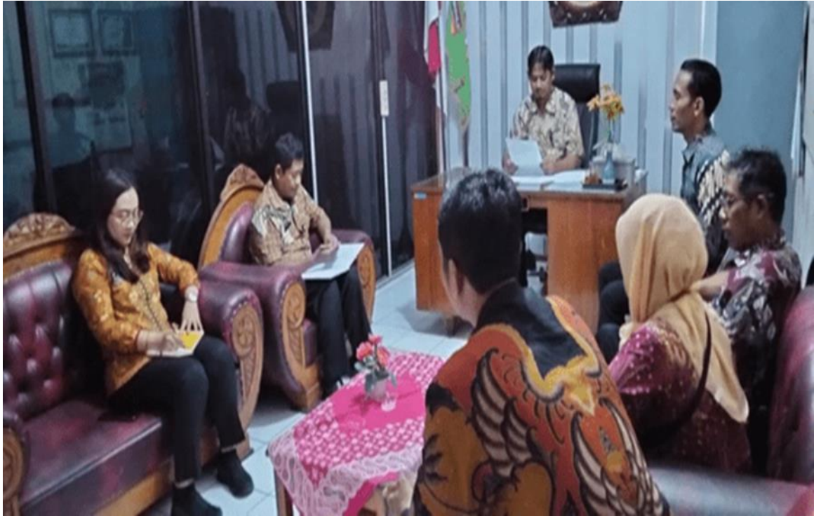
Rapat Inventarisasi Jenis Layanan dan Produk Kelurahan Jetis