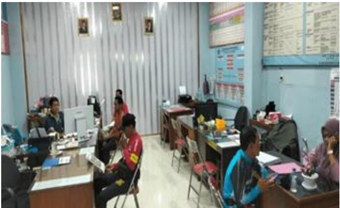
Penataan Beban Kerja Petugas (Redistribusi Tugas)