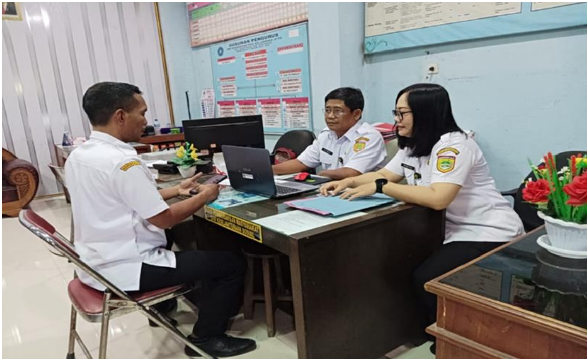
Monitoring dan Evaluasi Kesesuaian Produk Layanan