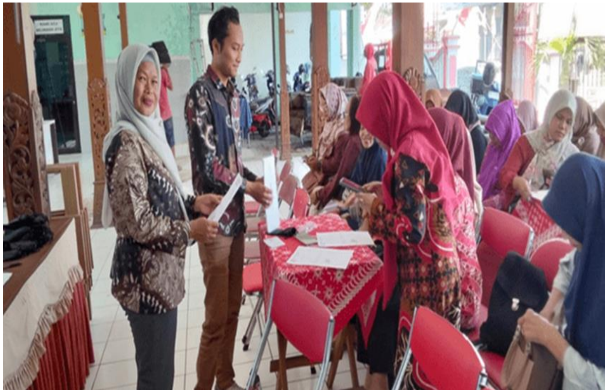
Dokumentasi Pelaksanaan SKM Semester 1 Tahun 2026