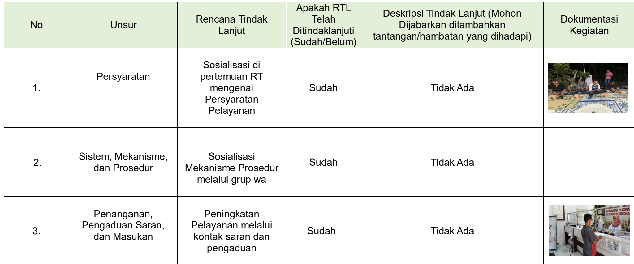
Tabel 3.2 Realisasi Rencana Tindak Lanjut