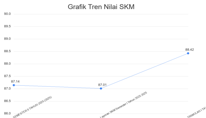
Gambar 2.2. Grafik Tren Nilai SKM

Tren tingkat kepuasan penerima layanan KELURAHAN BANMATI selama beberapa periode terakhir dapat dilihat melalui grafik di bawah ini. Grafik ini menggabungkan data historis yang diarsipkan dengan data yang dihasilkan oleh sistem untuk memberikan gambaran yang komprehensif.