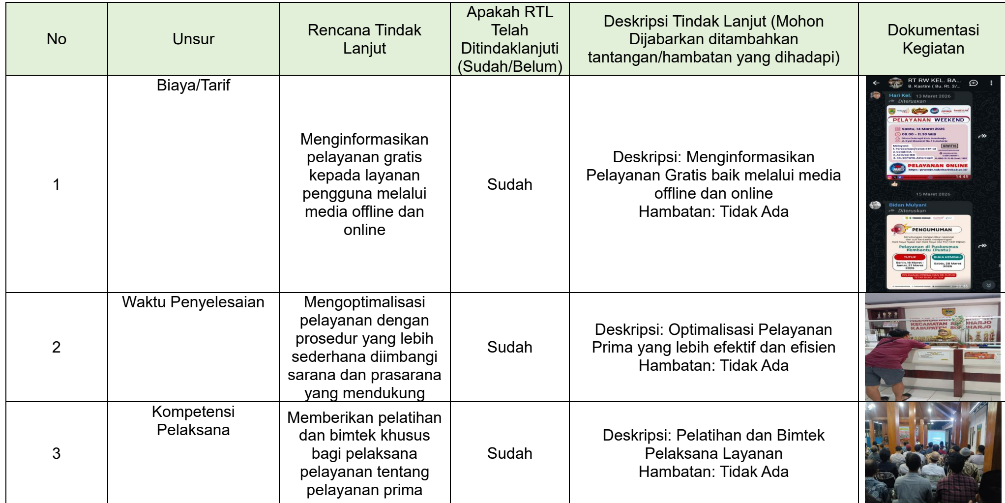
Tabel 3.2 Realisasi Rencana Tindak Lanjut