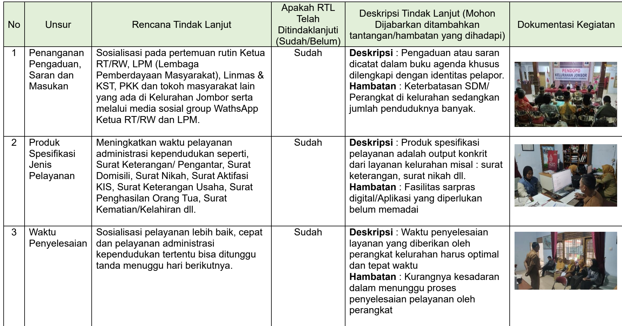
Tabel 3.2 Realisasi Rencana Tindak Lanjut