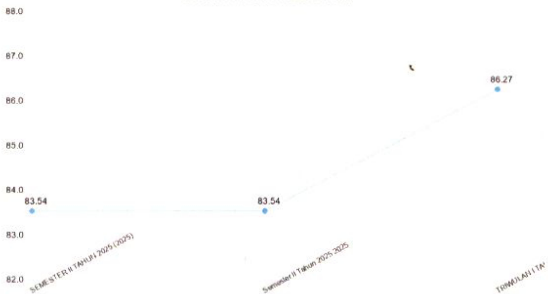
Grafik Tren Nilai SKM

Tren tingkat kepuasan penerima layanan KECAMATAN BULU selama beberapa periode terakhir dapat dilihat melalui grafik di bawah ini. Grafik ini menggabungkan data historis yang diarsipkan dengan data yang dihasilkan oleh sistem untuk memberikan gambaran yang komprehensif.