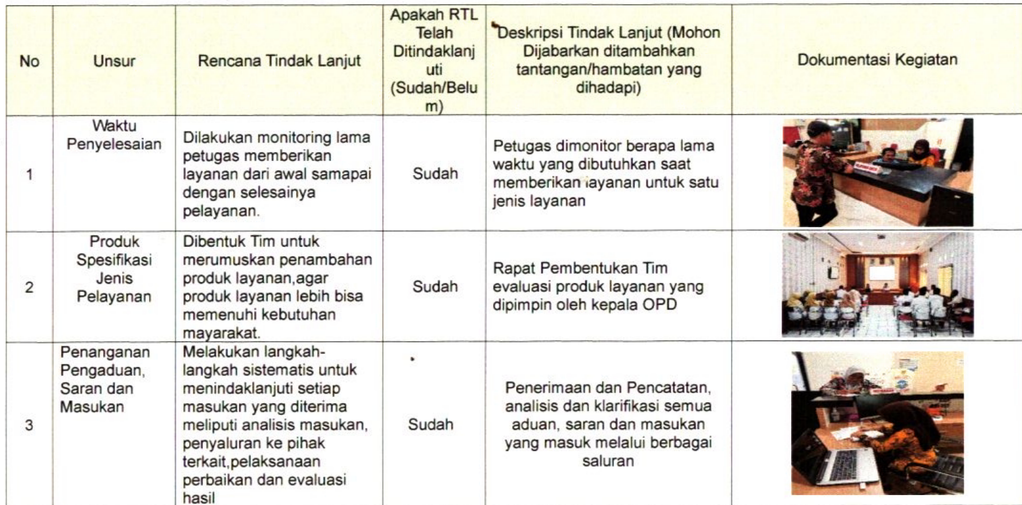
Tabel 3.2 Realisasi Rencana Tindak Lanjut