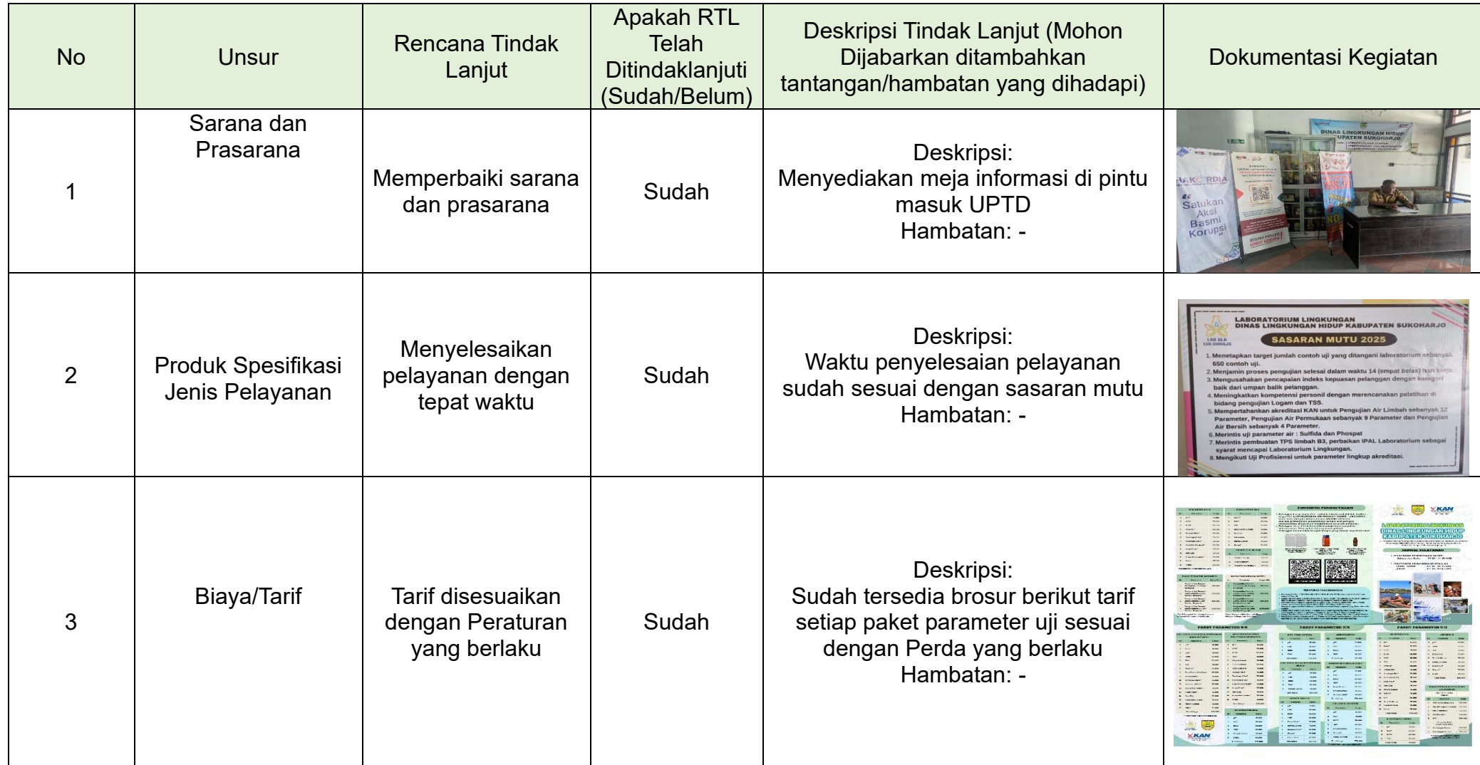
Tabel 3.2 Realisasi Rencana Tindak Lanjut