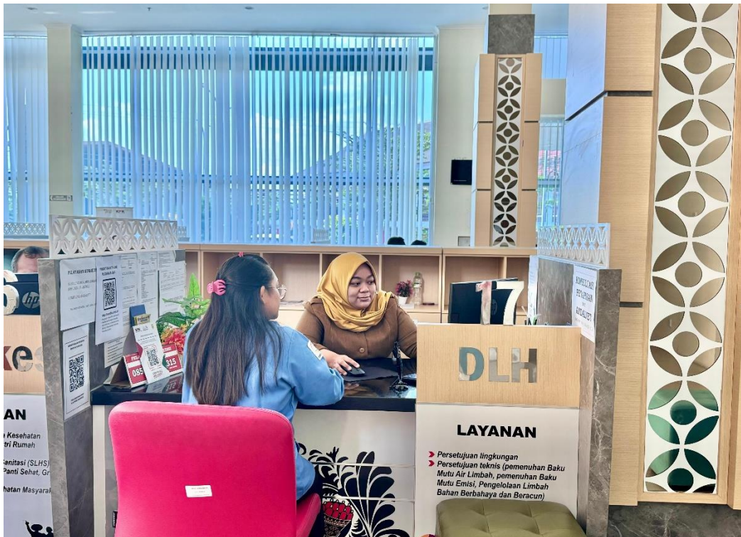
2.1 Pelaksanaan SKM Pelayanan di Mall Pelayanan Publik