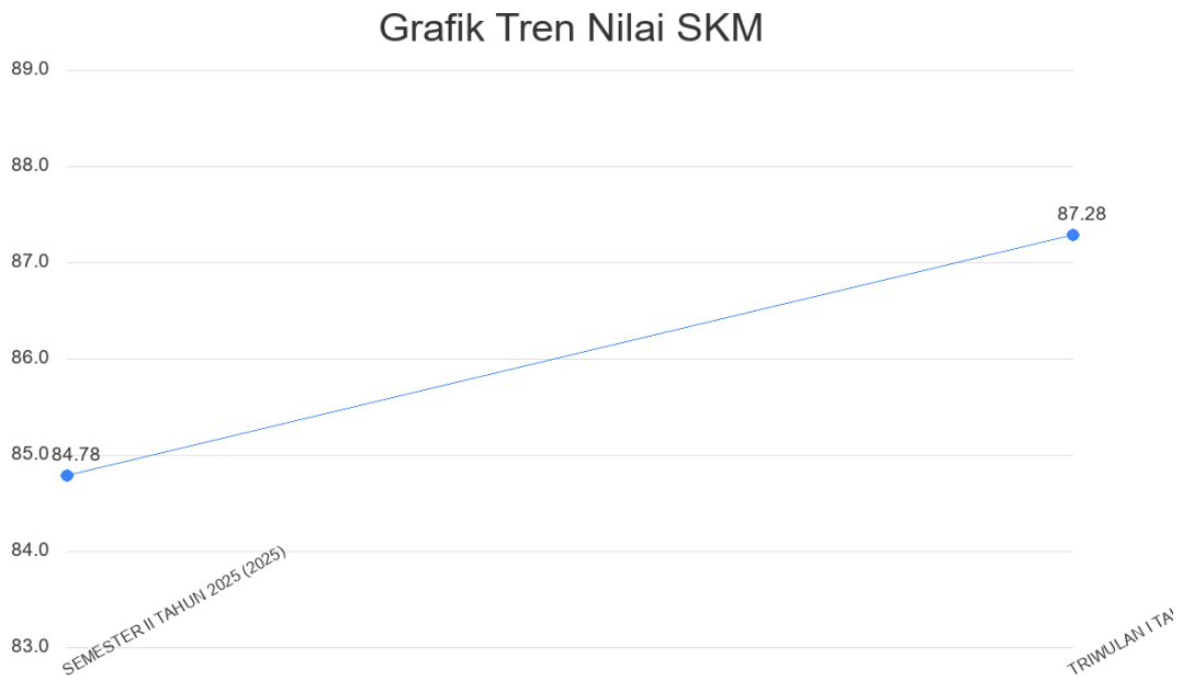
Gambar 2.2. Grafik Tren Nilai SKM

Tren tingkat kepuasan penerima layanan DINAS LINGKUNGAN HIDUP selama beberapa periode terakhir dapat dilihat melalui grafik di bawah ini. Grafik ini menggabungkan data historis yang diarsipkan dengan data yang dihasilkan oleh sistem untuk memberikan gambaran yang komprehensif.