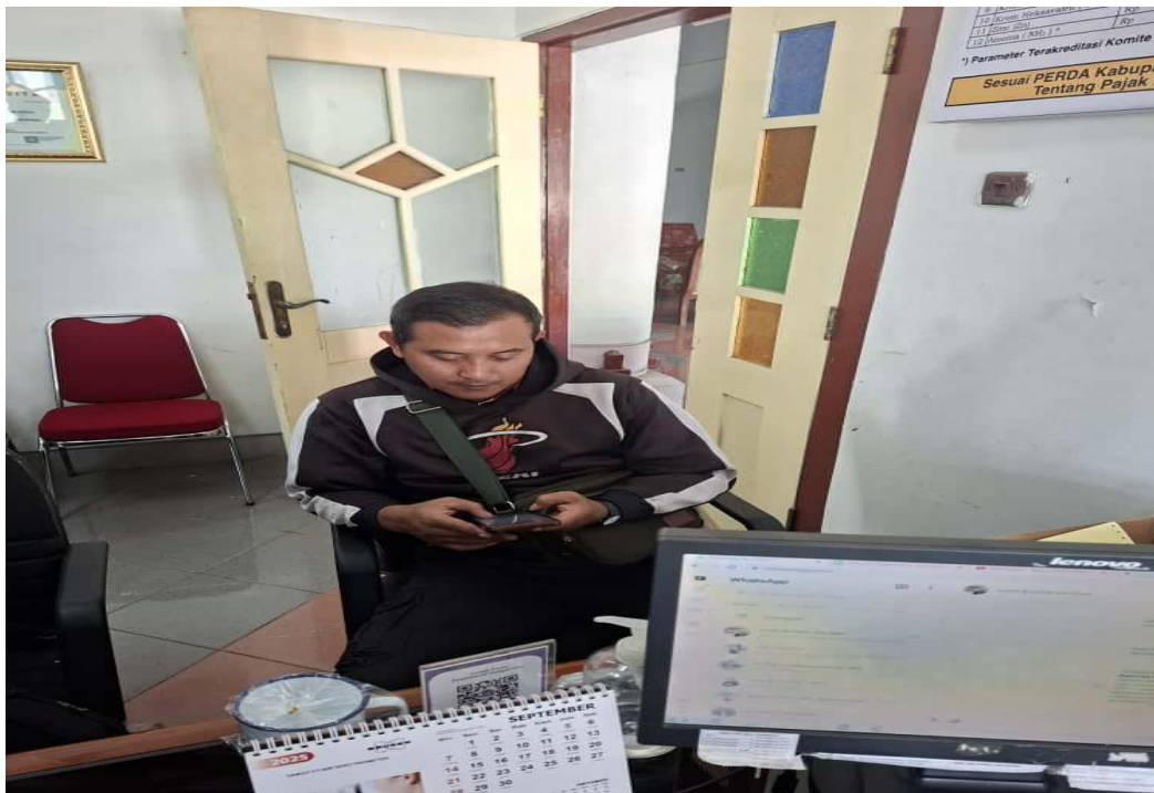
2.2 Pelaksanaan SKM Pelayanan Laboratorium