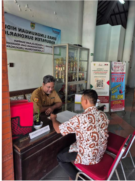
2.3 Pelaksanaan SKM Pelayanan Persampahan