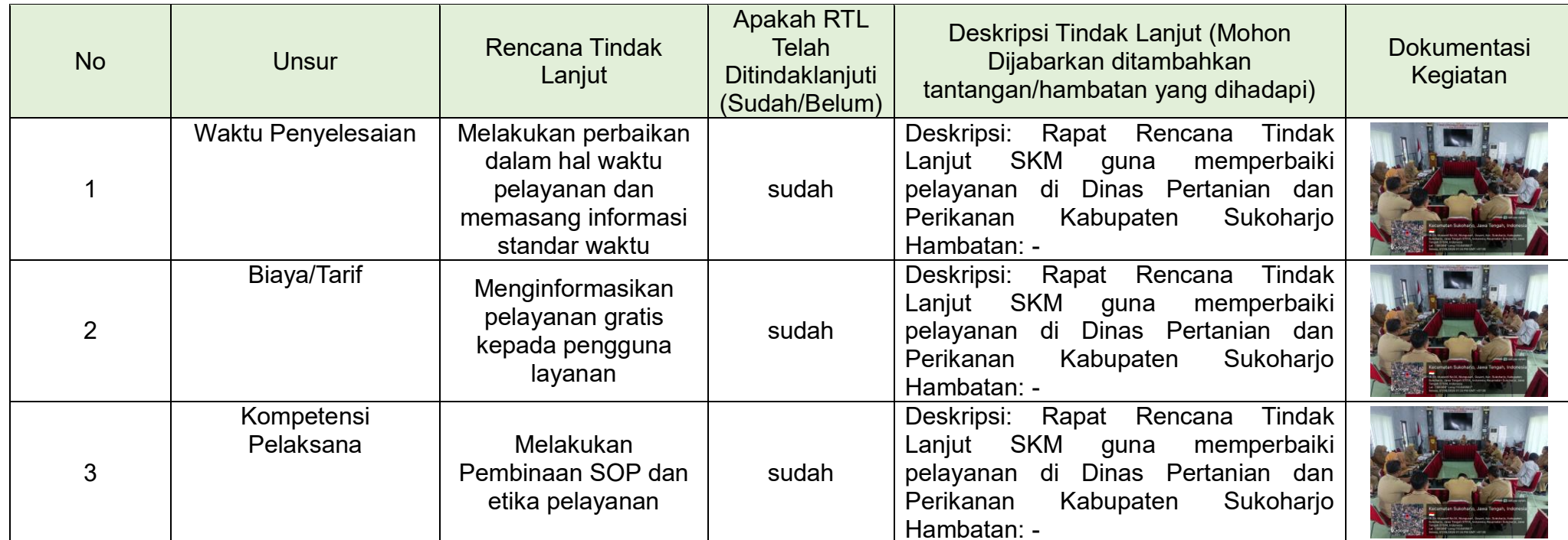
Tabel 3.2 Realisasi Rencana Tindak Lanjut