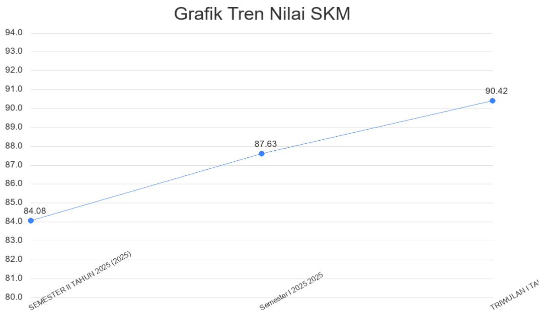
Gambar 2.2. Grafik Tren Nilai SKM

Tren tingkat kepuasan penerima layanan DINAS PERTANIAN DAN PERIKANAN selama beberapa periode terakhir dapat dilihat melalui grafik di bawah ini. Grafik ini menggabungkan data historis yang diarsipkan dengan data yang dihasilkan oleh sistem untuk memberikan gambaran yang komprehensif.