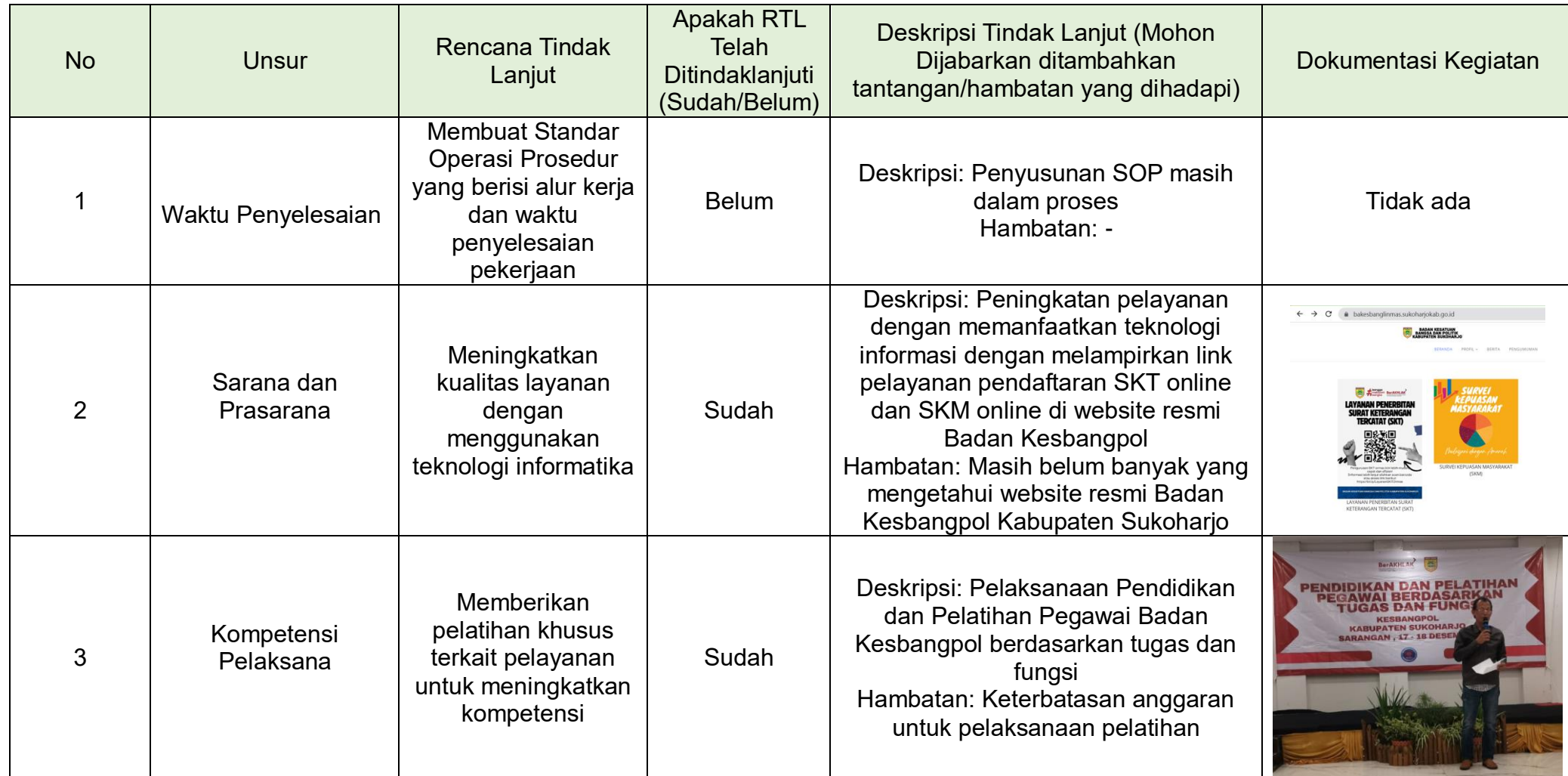
Tabel 3.2 Realisasi Rencana Tindak Lanjut