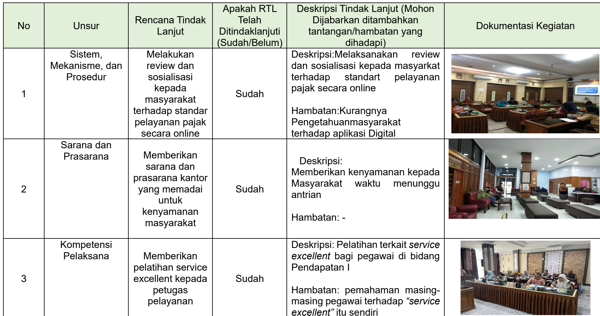
Tabel 3.2 Realisasi Rencana Tindak Lanjut