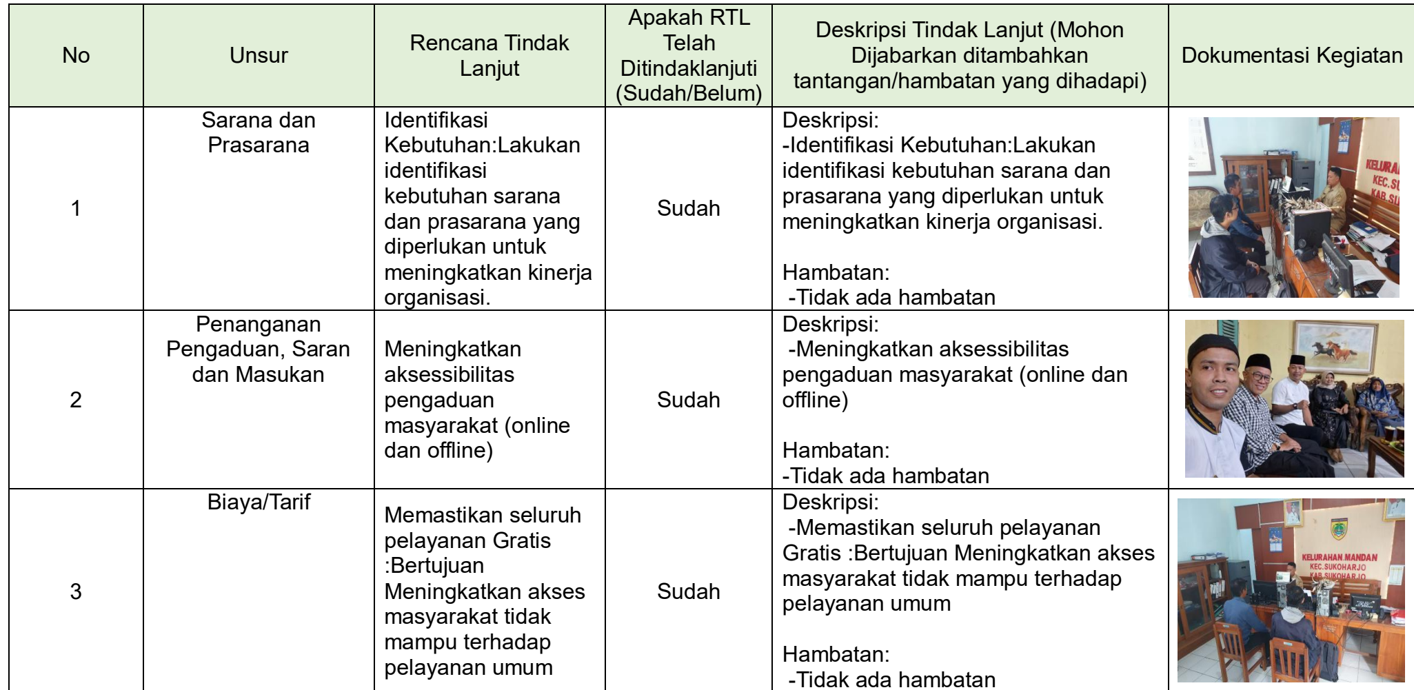
Tabel 3.2 Realisasi Rencana Tindak Lanjut