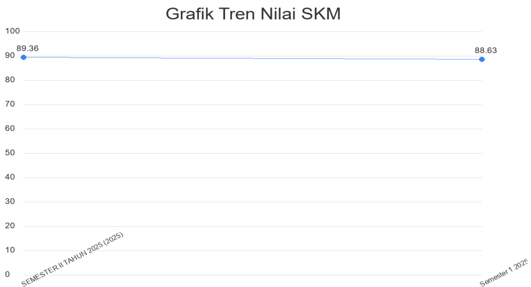
Gambar 2.2. Grafik Tren Nilai SKM

Tren tingkat kepuasan penerima layanan KECAMATAN TAWANGSARI selama beberapa periode terakhir dapat dilihat melalui grafik di bawah ini. Grafik ini menggabungkan data historis yang diarsipkan dengan data yang dihasilkan oleh sistem untuk memberikan gambaran yang komprehensif.