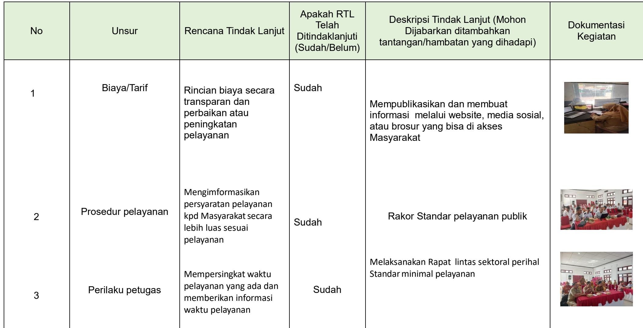
Tabel 3.2 Realisasi Rencana Tindak Lanjut