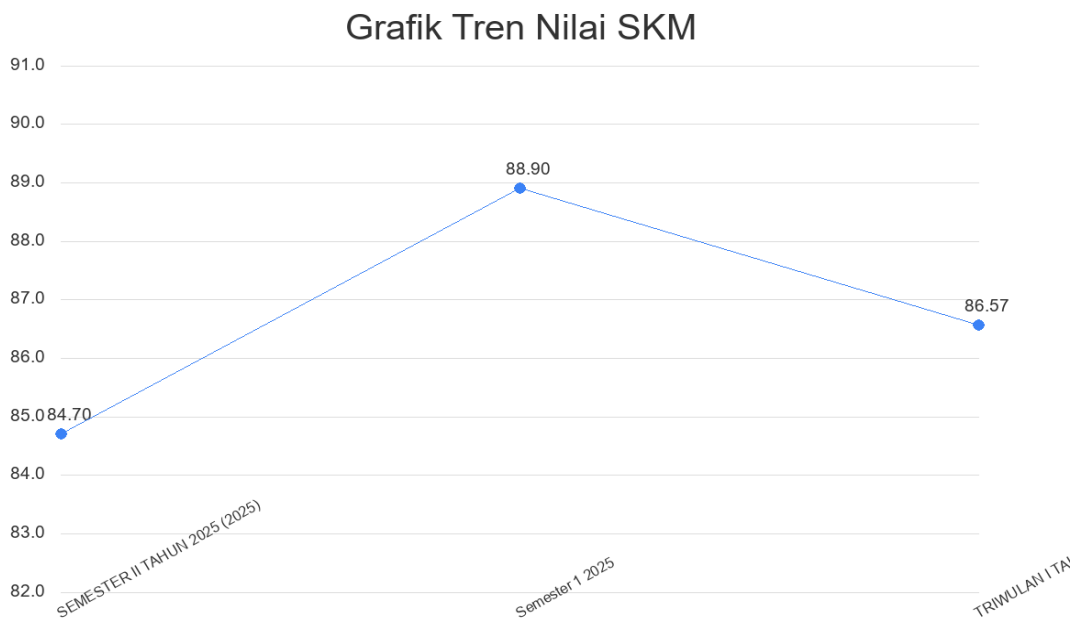
Gambar 2.2. Grafik Tren Nilai SKM

Berdasarkan grafik di atas, tren nilai Survei Kepuasan Masyarakat menunjukkan tren yang positif meskipun mengalami sedikit penurunan dari nilai 88.90 menjadi 86.57, akan tetapi untuk mutu layanan masih dalam katagori “Baik”. Secara keseluruhan, dapat disimpulkan bahwa Satuan Polisi Pamong Praja telah menunjukkan komitmen dalam mengoptimalkan kinerja pelayanan publik melalui berbagai upaya perbaikan yang berkelanjutan.