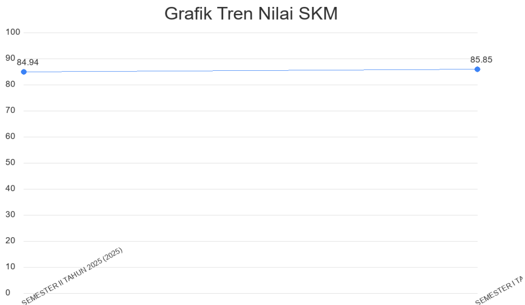
Gambar 2.2. Grafik Tren Nilai SKM

Tren tingkat kepuasan penerima layanan KECAMATAN GATAK selama beberapa periode terakhir dapat dilihat melalui grafik di bawah ini. Grafik ini menggabungkan data historis yang diarsipkan dengan data yang dihasilkan oleh sistem untuk memberikan gambaran yang komprehensif.