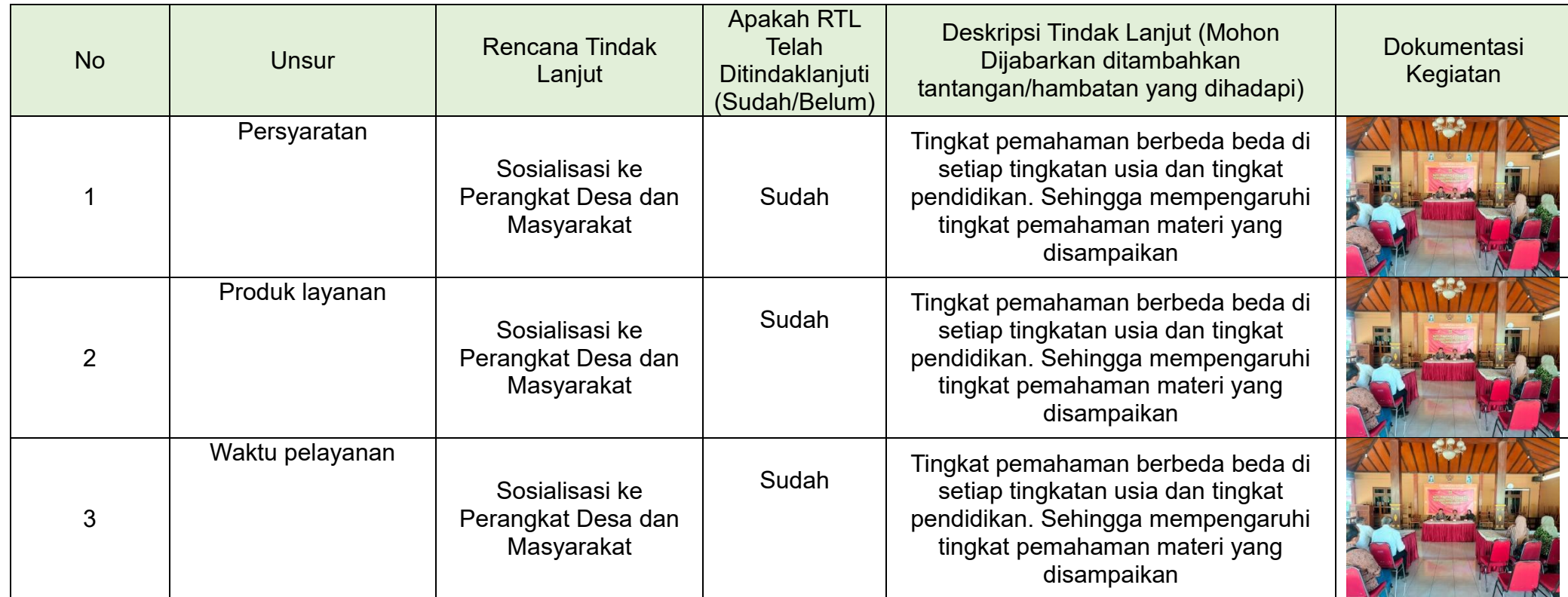
Tabel 3.2 Realisasi Rencana Tindak Lanjut