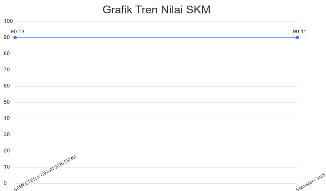
Gambar 2.2. Grafik Tren Nilai SKM

Tren tingkat kepuasan penerima layanan BADAN PENGELOLAAN KEUANGAN, PENDAPATAN DAN ASET DAERAH selama beberapa periode terakhir dapat dilihat melalui grafik di bawah ini. Grafik ini menggabungkan data historis yang diarsipkan dengan data yang dihasilkan oleh sistem untuk memberikan gambaran yang komprehensif.