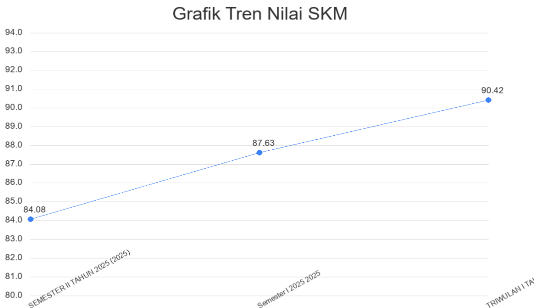
Gambar 2.2. Grafik Tren Nilai SKM

Tren tingkat kepuasan penerima layanan DINAS PERTANIAN DAN PERIKANAN selama beberapa periode terakhir dapat dilihat melalui grafik di bawah ini. Grafik ini menggabungkan data historis yang diarsipkan dengan data yang dihasilkan oleh sistem untuk memberikan gambaran yang komprehensif.