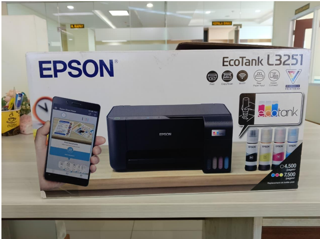
Foto Realisasi Pengadaan Printer