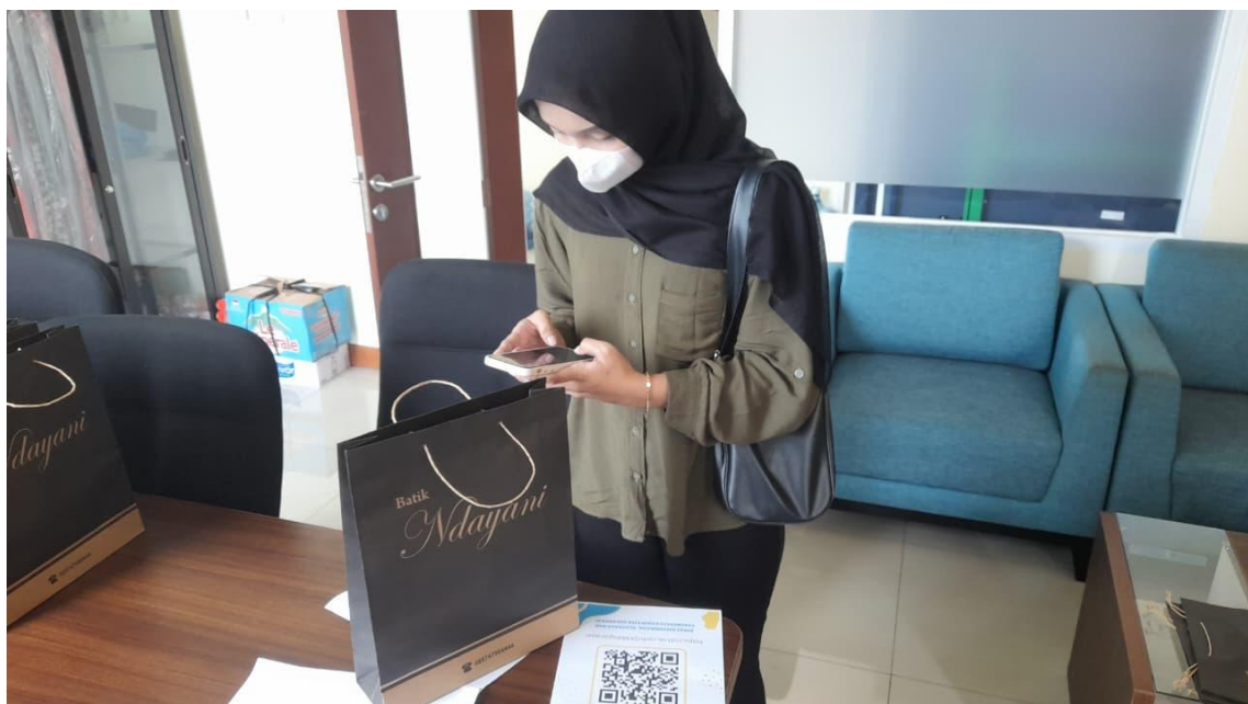
Foto Mahasiswa Penerima Layanan sedang mengisi quisioner SKM