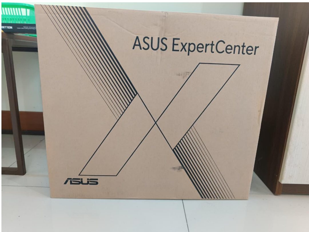
Foto Realisasi Pengadaan Komputer/PC