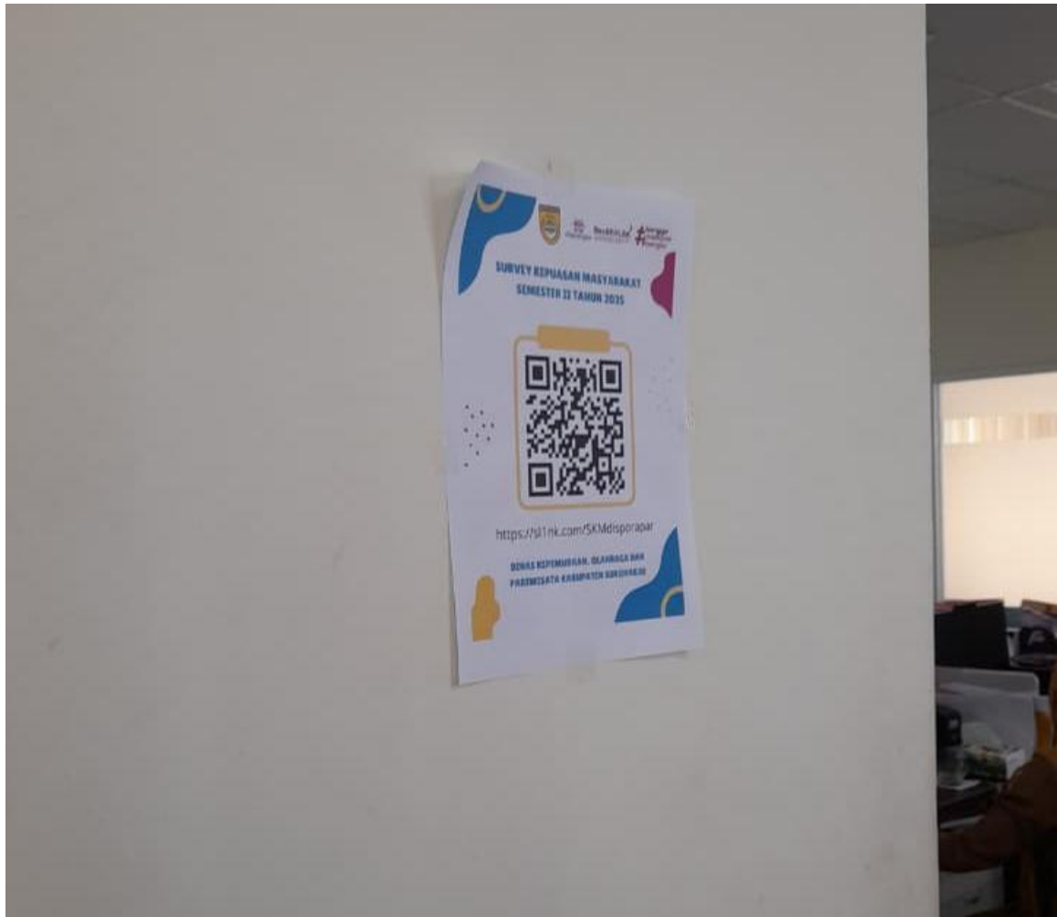
Foto QR SKM tempel di dekat ruang pelayanan