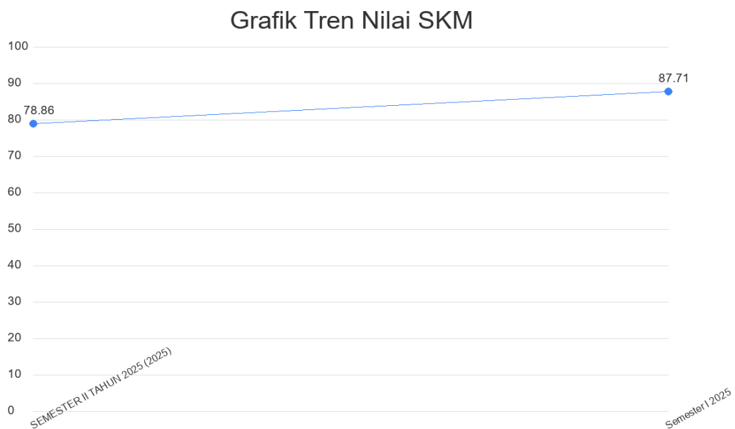
Gambar 2.2. Grafik Tren Nilai SKM

Tren tingkat kepuasan penerima layanan KELURAHAN BULAKREJO selama beberapa periode terakhir dapat dilihat melalui grafik di bawah ini. Grafik ini menggabungkan data historis yang diarsipkan dengan data yang dihasilkan oleh sistem untuk memberikan gambaran yang komprehensif.