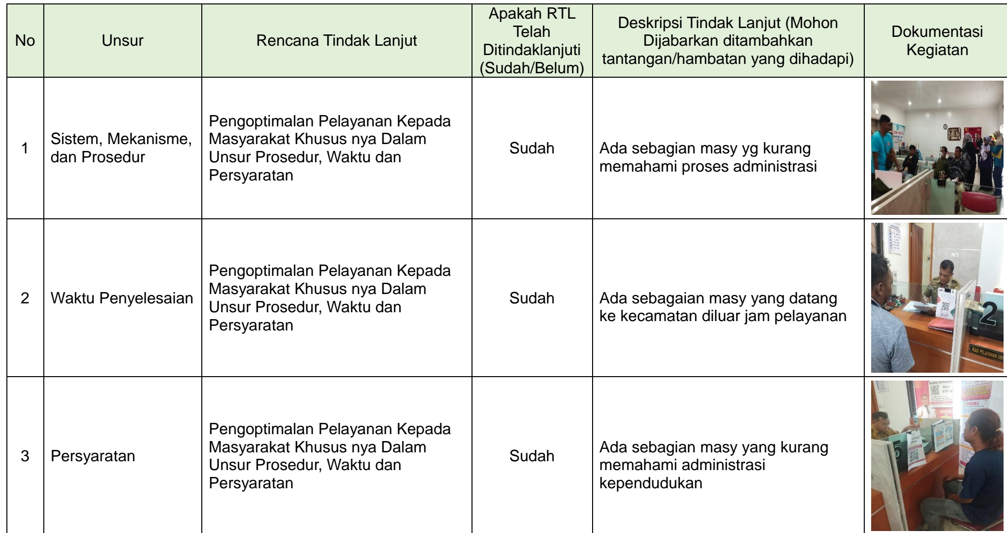
Tabel 3.2 Realisasi Rencana Tindak Lanjut