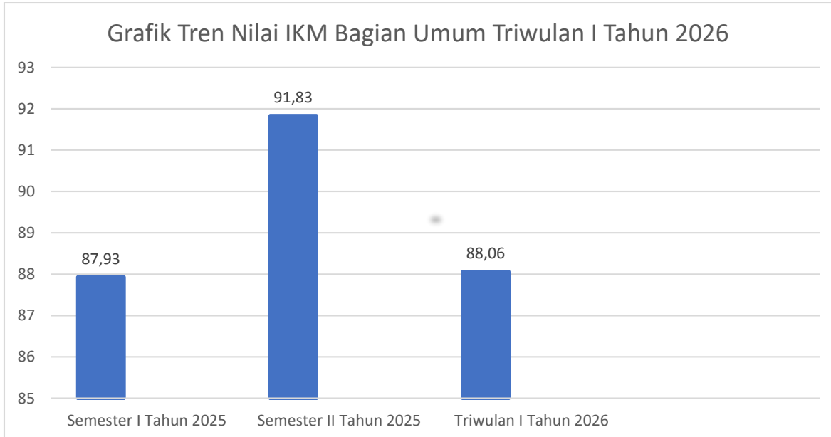
Gambar 2. 2 Grafik Tren Nilai SKM

Berdasarkan grafik di atas, tren nilai SKM menunjukkan tren penurunan yang perlu menjadi perhatian. Secara keseluruhan, dapat disimpulkan bahwa Bagian Umum telah menunjukkan komitmen dalam mengoptimalkan kinerja pelayanan publik melalui berbagai upaya perbaikan yang berkelanjutan.