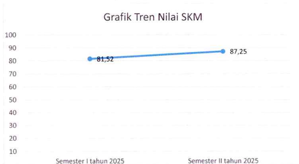
Gambar 2.2. Grafik Tren Nilai SKM

Tren tingkat kepuasan penerima layanan INSPEKTORAT DAERAH selama beberapa periode terakhir dapat dilihat melalui grafik di bawah ini. Grafik ini menggabungkan data historis yang diarsipkan dengan data yang dihasilkan oleh sistem untuk memberikan gambaran yang komprehensif.