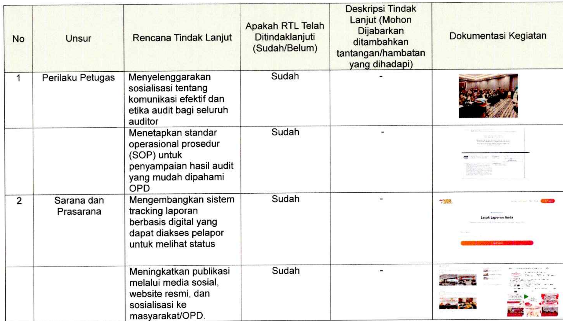
Tabel 3.2 Realisasi Rencana Tindak Lanjut