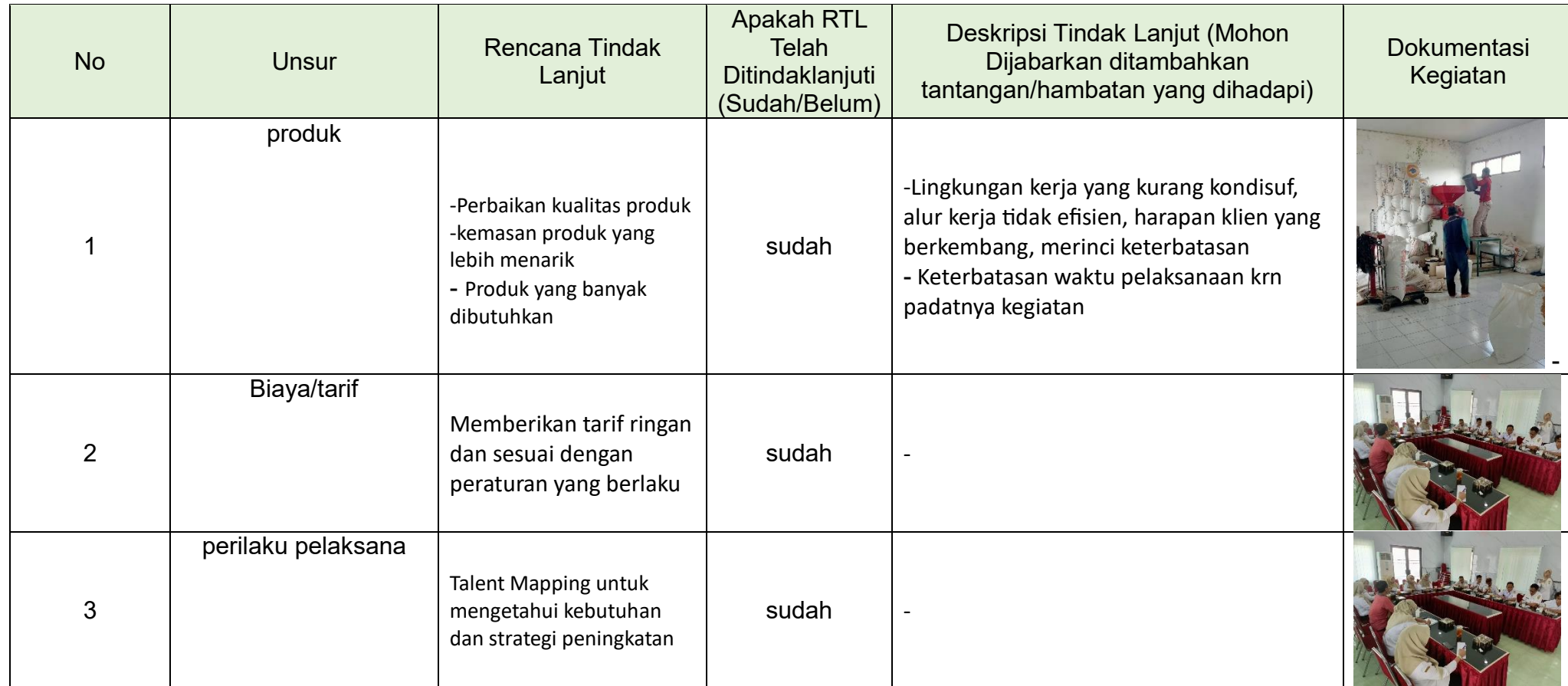
Tabel 3.2 Realisasi Rencana Tindak Lanjut