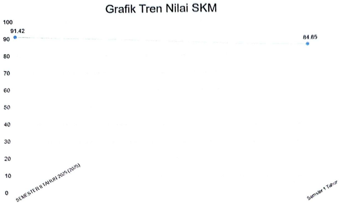
Gambar 2.2. Grafik Tren Nilai SKM

Berdasarkan grafik di atas, tren nilai SKM menunjukkan tren penurunan yang perlu menjadi perhatian. Secara keseluruhan, dapat disimpulkan bahwa DINAS PERINDUSTRIAN DAN TENAGA KERJA telah menunjukkan komitmen dalam mengoptimalkan kinerja pelayanan publik melalui berbagai upaya perbaikan yang berkelanjutan.