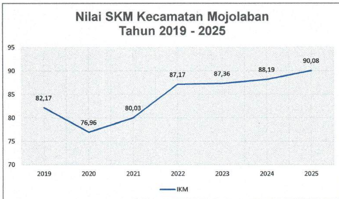
Gambar 2.2. Grafik Tren Nilai SKM

Berdasarkan grafik di atas, tren nilai SKM terjadi konsistensi peningkatan kinerja penyelenggaraan pelayanan publik dari tahun 2019 hingga 2025. Secara keseluruhan, dapat disimpulkan bahwa KECAMATAN MOJOLABAN telah menunjukkan komitmen dalam mengoptimalkan kinerja pelayanan publik melalui berbagai upaya perbaikan yang berkelanjutan.