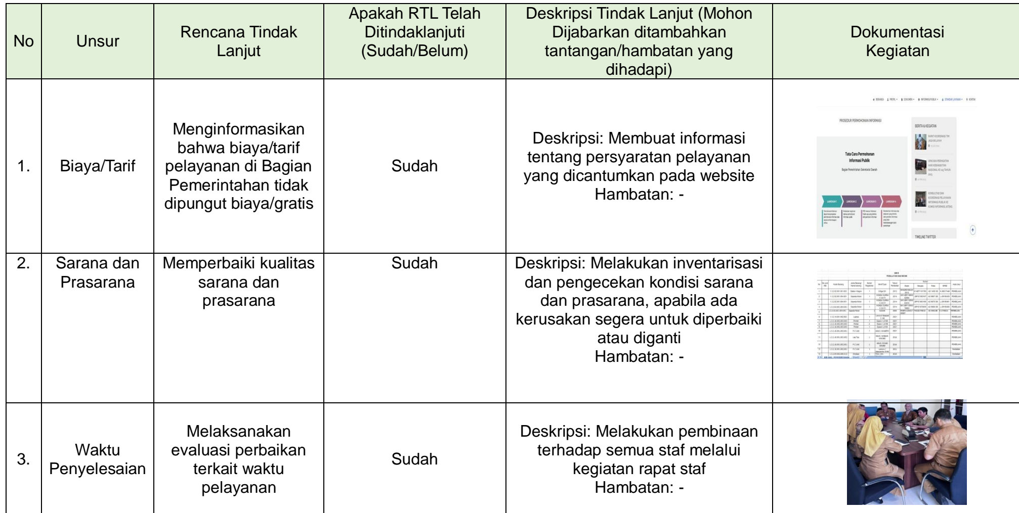
Tabel 3.2 Realisasi Rencana Tindak Lanjut